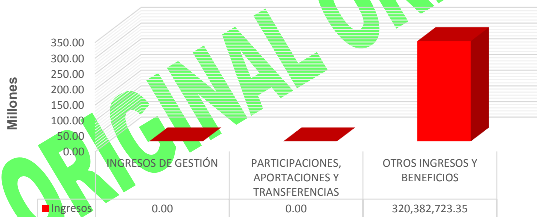
GRÁFICA 1 INGRESOS